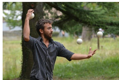
Champ de foire