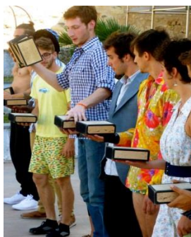
Champ de foire