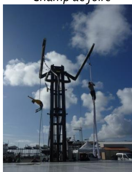
Salon Nautique Arcachon