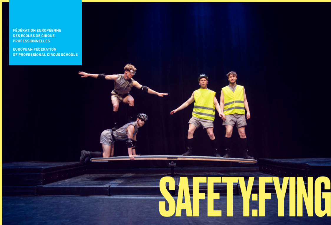
Artists : 4 on board (graduates SKH-Circus BA 2020) Act : Safety first

IN PARTNERSHIP WITH STOCKHOLM UNIVERSITY OF THE ARTS - SKH